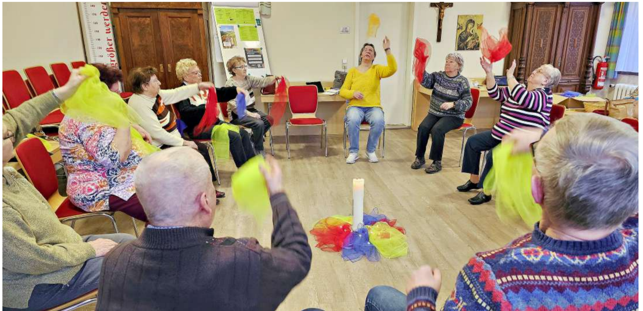
Die Sitztanzgruppe der Malteser in Köthen wird ehrenamtlich geleitet und möchte weitere Seniorinnen und Senioren zu gemeinsamer Bewegung einladen.

Einen umfassenden Einblick in die Studiengänge und Fachbereiche der Hochschule Anhalt bieten die Hochschulinformationstage (HIT). Am Samstag, dem 4. Mai 2024, findet der HIT von 10 bis 14 Uhr am Campus Bernburg statt. Am 1. Juni 2024 öffnet der Campus Köthen von 14 bis 18 Uhr seine Türen für interessierte Besucher. Der Campus Dessau lädt am 12. und 13. Juli 2024 zum Campusfest, HIT und zur Dessau-Design-Schau ein. Die Informationsveranstaltungen bieten Interessierten einen umfassenden Einblick in die verschiedenen Fachbereiche und Studiengänge der Hochschule. Bewerbungen zum Wintersemester 2024/25 sind ab sofort möglich.