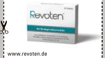
Abbildung Betroffenen nachempfunden. REVOTEN. Wirkstoffe: Acidum silicicum Trit. D4, Calcium carbonicum Hahnemannii Trit. D4. Die Anwendungsgebiete entsprechen den homöopathischen Arzneimittelbildern. Dazu gehört: Bindegewebsschwäche. www.revoten.de • Zu Risiken und Nebenwirkungen lesen Sie die Packungsbeilage und fragen Sie Ihre Ärztin, Ihren Arzt oder in Ihrer Apotheke. • Remitan GmbH, 82166 Gräfelfing

Für Ihre Apotheke: Revoten Tabletten (PZN 18405588)