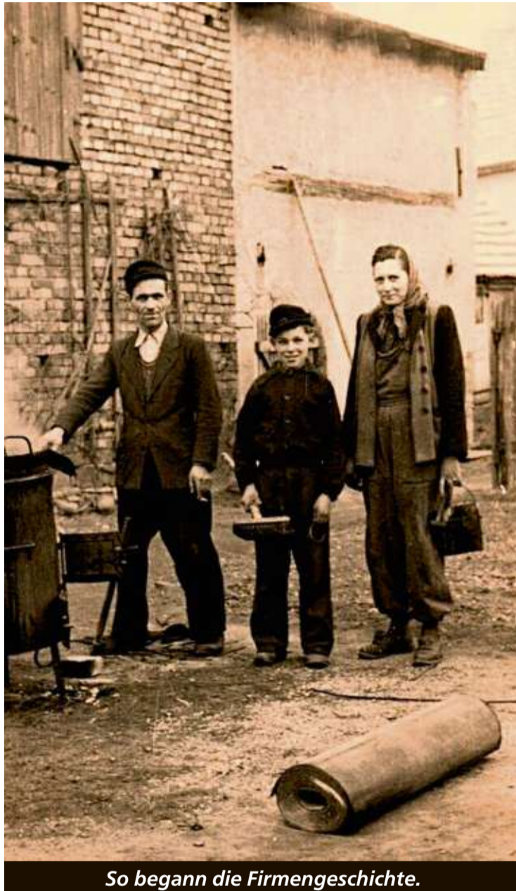
So begann die Firmengeschichte.