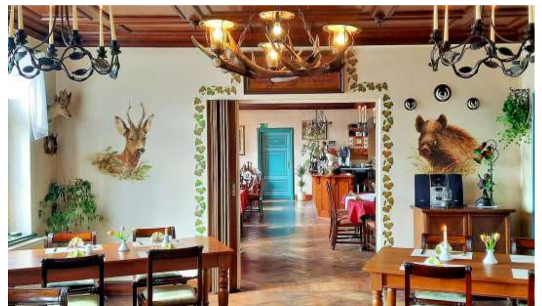
Entdecken Sie einzigartige Schätze und seltsame Sammelsurien in Ihrer Region, hier zu sehen: das Gutshaus Büttnerhof.

Sie wollen es lieber etwas ruhiger angehen und ganz entspannt stöbern, bummeln oder schlendern? Kein Problem! Wir haben eine Übersicht mit Märkten aus der Region für Sie zusammengestellt. Oder Sie testen einen unserer zahlreichen Ausflugs-tipps zu den größten, wunderlichsten und wertvollsten Sammlungen Sachsen-Anhalts.