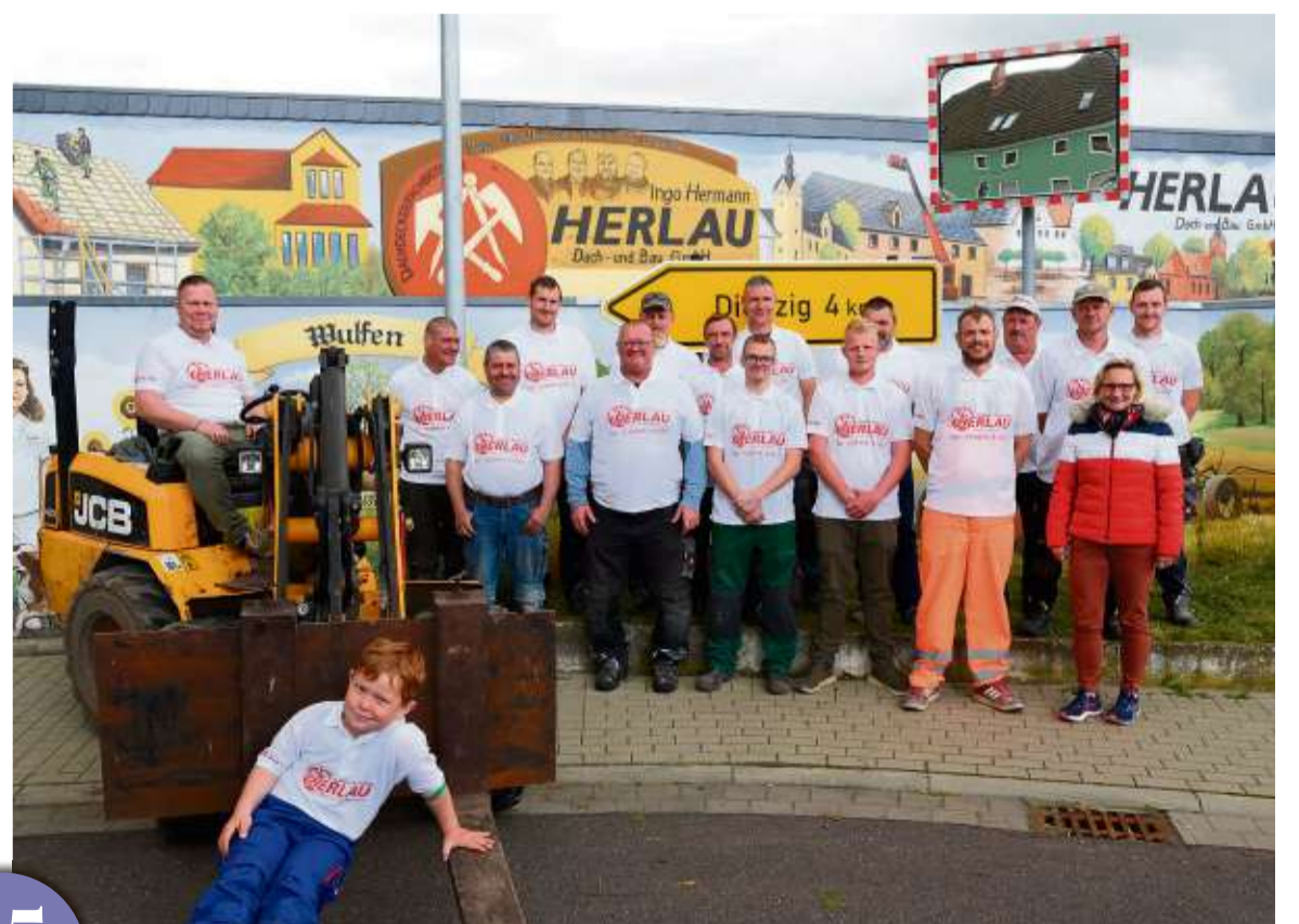
Das Team der Firma Herlau – seit 25 Jahren für Sie im Einsatz.